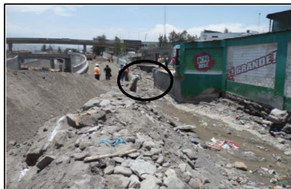
Fig. 2- Vistas del estrangulamiento del cauce de la torrentera Venezuela (mercado El Palomar) cuando se produjeron las inundaciones en el 2013 (Foto: G. Luque).

El 8 de febrero 2013, en horas de la tarde ocurrió una lluvia inusual, de 124.5 mm, generando la activación de las torrenteras San Lázaro, Av. Venezuela y Los Incas (Fig. 2), con generación de flujos de aguas y de detritos que se desbordaron y causaron inundaciones, que afectaron 50 km de vías, el sistema de agua potable y desagüe, destruyó 280 viviendas, afectó otras 10 mil, además, afectó centros comerciales, causó la muerte de 6 personas y graves daños en la ciudad (Ettinger et al., 2015). La estación La Pampilla registró como una lluvia excepcional no registrada al menos los últimos 24 años.