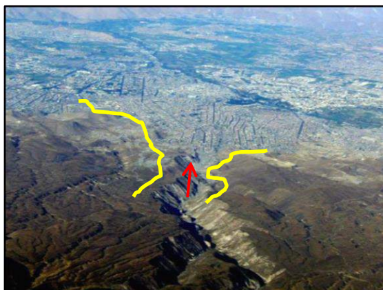
Fig. 3- Vista desde el volcán Misti hacia la ciudad de Arequipa. Esta quebrada nace en el cráter del volcán, y abre su abanico aluvial donde se ubican las viviendas de más de 100,000 pobladores.

En 1868, fue necesaria la renovación urbana de la ciudad de Arequipa a raíz del sismo registrado ese año que destruyó parcialmente la ciudad, construyendo infraestructura de influencia europea en áreas urbanas vulnerables, como, construcción de urbanizaciones en el área de influencia del río Chili sin considerar los peligros naturales que amenazan esta zona.