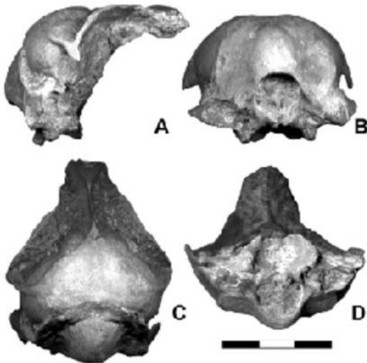
FIG. 3. Cráneo SGO - PV 790 Pygoscelis calderensis sp. nov.: A. vista lateral; B. vista caudal; C. vista dorsal; D. vista ventral. Escala: 30 mm.

cies actuales del género Spheniscus . Además, al igual que el nuevo taxón (MEF-PV 100) procedente de Patagonia que actualmente se encuentra bajo estudio (Cozzuol et al. , 1993), Spheniscus carece de reborde supraorbitario en la fosa glandulae nasalis .