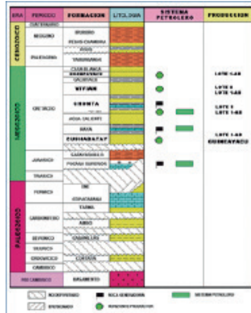
Figura N.º 3. Columna Generalizada de la Cuenca Ucayali.