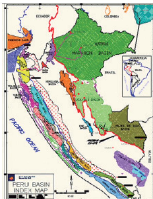
Figura N.º 1. Mapa índice.

estos sistemas. Se propone analizar sísmicamente los dos grupos de sistemas carbonatados que pueden tener un efecto combinado de variaciones de facies deposicionales y alteraciones diagenéticas, las cuales juegan un rol importante en las variaciones de velocidades sísmicas y en la impedancia acústica (Masferro JL, Bourne R., Jauffred JC., 2005).