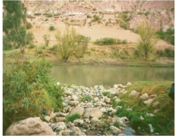
Foto 5. Efluente de aguas residuales domésticas al río Vilcanota, octubre de 2005.

Aportes de carga orgánica de actividades ganaderas y otras actividades. Estos aportes de contaminantes son generalmente difíciles de controlar, pues principalmente la actividad ganadera está dispersa a lo largo de todo el valle, así mismo la actividad agrícola está presente en ambas márgenes del río Vilcanota y no solamente en el área de estudio.