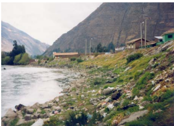
Foto 7. Residuos sólidos en la provincia de Calca zona Minasmocco.