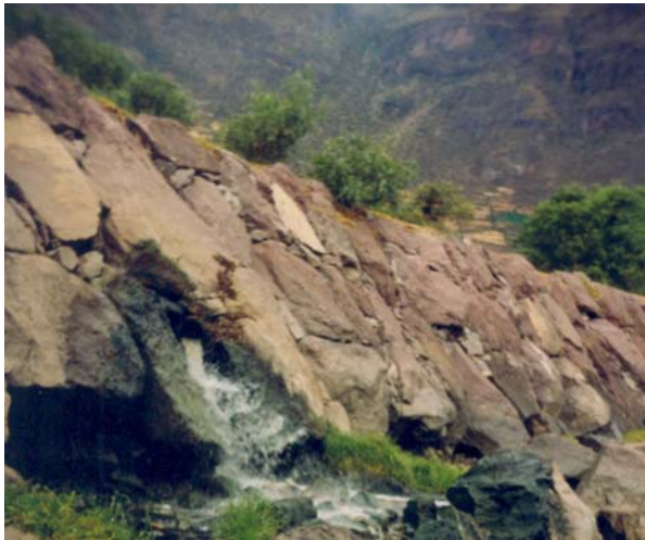
Foto 3. Efluente de aguas residuales al río Vilcanota, octubre de 2005.

Efluentes urbanos-domésticos. Podemos encontrar esta fuentes en las capitales de provincias, principalmente Calca y Urubamba, que descargan directamente sus efluentes al río Vilcanota sin tratamiento previo (Fotos 3, 4, 5).