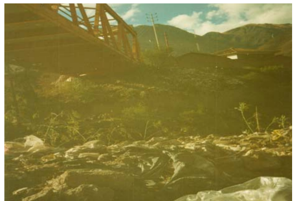
Foto 6. Residuos sólidos en el puente de la provincia de Urubamba, octubre de 2005.

Aportes de carga por residuos sólidos. El Municipio de Urubamba cuenta con un relleno sanitario que recoge los residuos de la ciudad de Urubamba y Huayllabamba, el resto de centros poblados no cuenta con este servicio y solo tienen botaderos y, en algunos casos, los pobladores asentados en las riberas del río prefieren arrojar sus residuos sólidos directamente al río causando gran daño. Cabe mencionar que otro aspecto muy resaltante es el gran incremento de la actividad turística en el área de estudio, la cual incorpora también residuos sólidos en el río, materiales plásticos en su mayoría (Fotos 6, 7, 8).