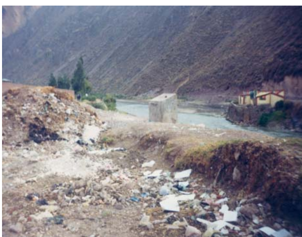
Foto 8. Residuos sólidos en la provincia de Calca, octubre de 2005.