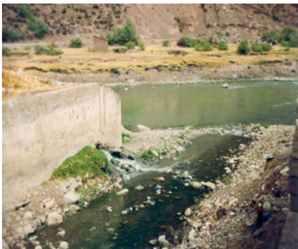
Foto 4. Efluente de aguas residuales al río Cochoc y río Vilcanota, octubre de 2005.