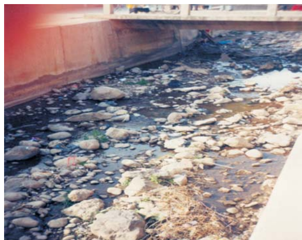
Foto 1. Río Cochoc, octubre de 2005, Calca.

Río Cochoc. Este río cruza la ciudad de Calca, recibe durante su trayectoria diferentes clases de contaminantes, en su mayoría líquidos y sólidos de origen urbano-domésticos que afectan la fauna y flora del río en los meses donde no se presentan lluvias (abril a julio); en épocas de lluvias el caudal del río aumenta considerablemente así como los sólidos suspendidos en él siendo, esencialmente, este río es estacionario. (Foto 1)