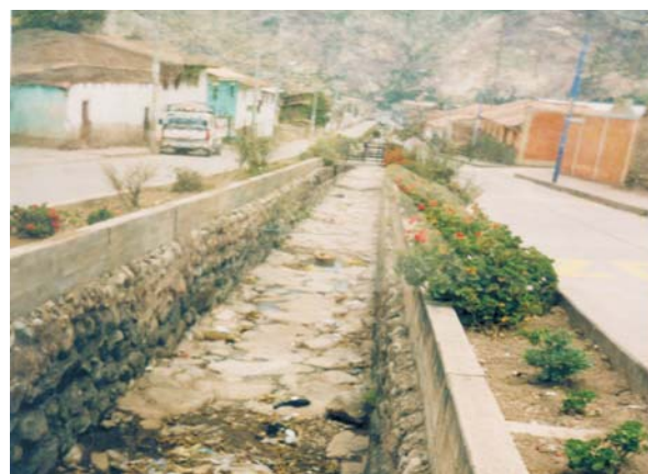
Foto 2. Río Tullumayu, octubre de 2005, Urubamba.

Río Tullumayu. Atraviesa la parte central de la ciudad de Urubamba, es principalmente un colector que recibe durante su trayectoria diferentes clases de contaminantes, en su mayoría líquidos y sólidos de origen urbano-domésticos, que afectan de manera considerable la fauna acuática (Foto 2).