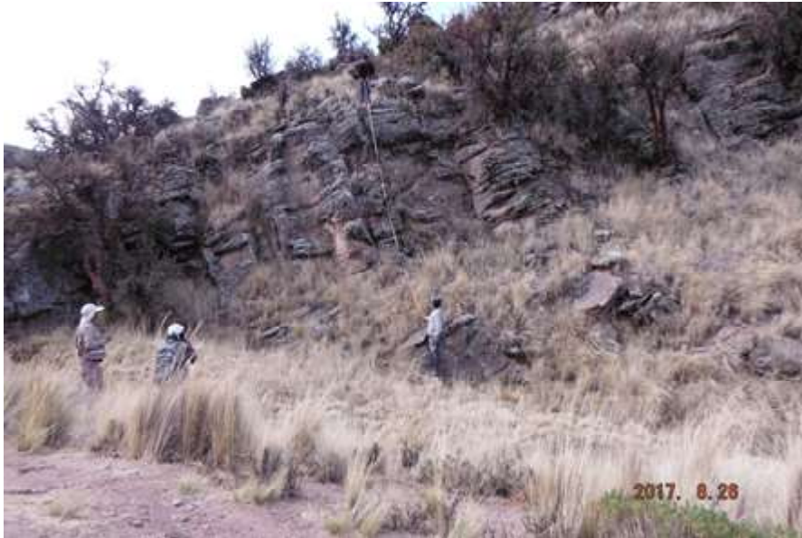
Figura 1 Cerro Mojon Loma