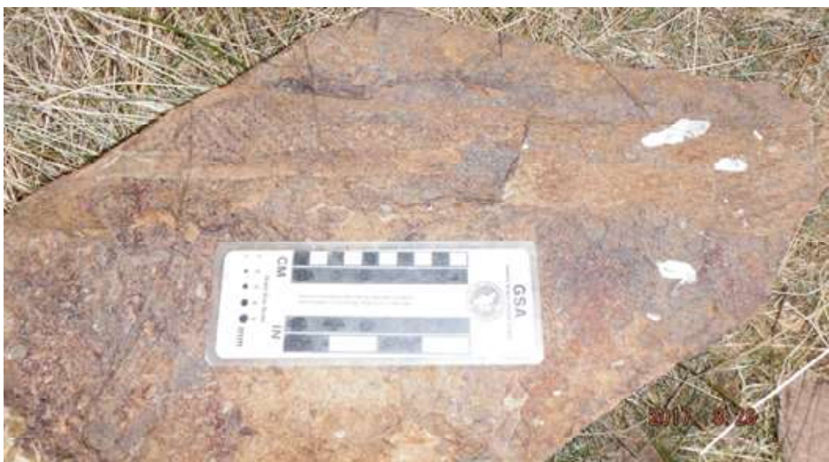
Figura 3 Planta fósil