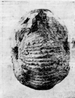
Fig. N.º 2