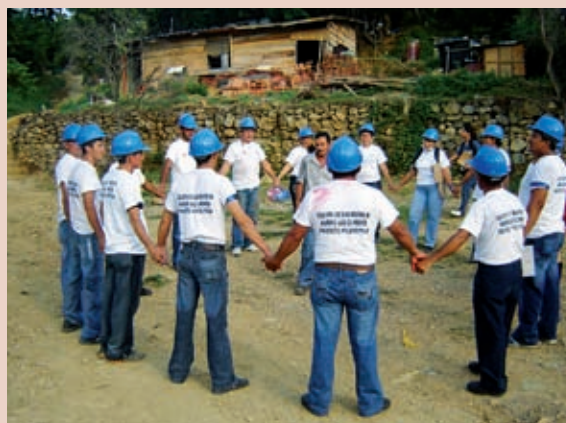
Foto 8. Organización de la comunidad para la respuesta a emergencias.

proyecto a nivel participativo. La emisora comunitaria apoyó todo lo referente a la comunicación, divulgación y capacitación de las comunidades. Finalmente, el Consejo Territorial de Planeación fue importante para la incorporación de la gestión del riesgo en la planeación frente al desarrollo, cuya participación como órgano consultivo del tomador de decisiones, animó la participación de sectores y actores poco comprometidos inicialmente.