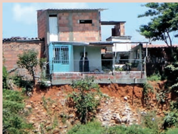
Foto 2: Escenario de riesgo en el borde de terraza. Barrio Montebello.

El estado físico del barrio se caracteriza como precario, con viviendas construidas en materiales transitorios y mal estado; el 84% de las viviendas cuenta con una sola unidad habitacional que se emplea como cocina, dormitorio y espacio social, mientras que el 9% cuenta con dos habitaciones y una cocina provisional. Por otra parte, las viviendas tienen un alcantarillado incipiente construido por sus propios habitantes y, en algunos casos, las aguas servidas son descargadas directamente sobre el terreno, generando problemas de erosión e insalubridad (Proyecto Piloto, 2008:4).