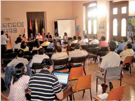
Foto 9: Taller para la articulación con niveles regionales y nacionales.

de una adecuada comunicación, dinamismo e integración entre la comunidad y las instituciones públicas y privadas; y (iv) carencia en la oferta institucional para capacitar la comunidad.