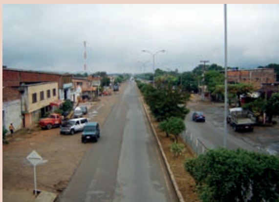
Foto 3: Avenida Panamericana. Vía nacional Cúcuta - Pamplona.

Frente a la salud y el saneamiento básico existen condiciones de vulnerabilidad, como la ausencia de planes hospitalarios de emergencias en los centros de salud, la carencia en los análisis de vulnerabilidad física en el hospital de primer nivel y la debilidad en el conocimiento en preparativos para la respuesta ante un desastre, tal