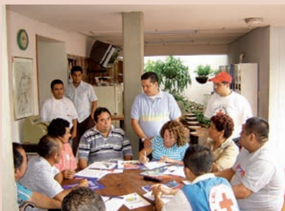
Foto 5: Reunión entre actores institucionales y comunitarios.

Prevención y Atención de Desastres (DPAD), CORPONOR, la Alcaldía Municipal de Los Patios, CREPAD y CLOPAD. De igual forma, se concertó con los líderes de las Juntas de Acción Comunal (JAC) de los barrios Las Cumbres y su área de influencia, El Sol y Daniel Jordán. A continuación, se señalan los aprendizajes significativos en el involucramiento y potenciación de actores y recursos locales.