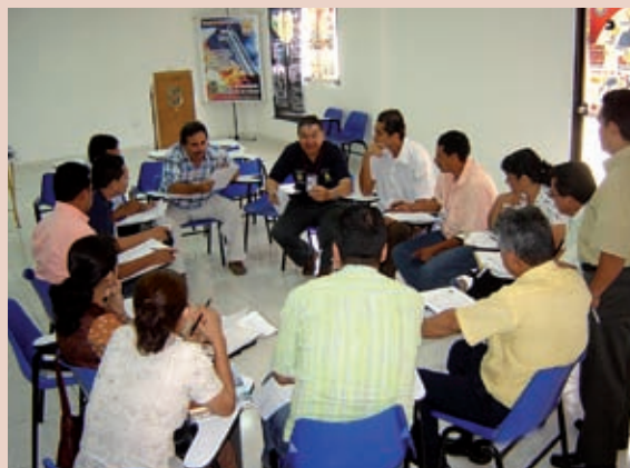
Foto 4: Encuentro participativo para la formulación del Plan Local de Emergencia.

y seguimiento. Para lograr la vinculación y participación activa de los diversos actores, se realizaron talleres de planeación participativa, con los líderes comunales, las organizaciones de base y los miembros de las distintas instituciones públicas y privadas. Es preciso resaltar como aspecto innovador, la realización de un mapa de equipamiento (de hospitales, centros de salud, edificaciones públicas y líneas vitales, sitios de concentración masiva, sitios para posibles albergues y alojamientos temporales, posibles rutas de evacuación y movilidad, entre otros) con la participación de los actores sociales.