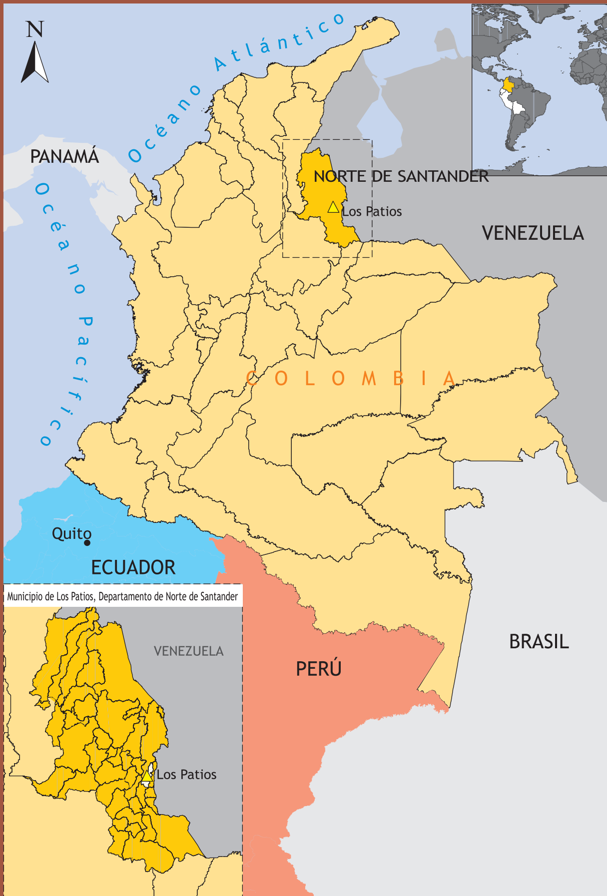
Mapa de ubicación de proyecto piloto