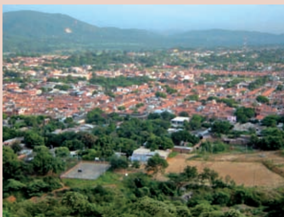
Foto 1: Vista Panorámica del Municipio de Los Patios.

El Municipio 1 de Los Patios está ubicado en el Departamento de Norte de Santander en el nororiente colombiano y tiene un área de 131 km 2 . A partir de los años 30 del siglo XX se evidenció un paulatino ascenso poblacional en la zona relacionado con el funcionamiento de la carretera (Cúcuta-Pamplona-Bucaramanga 2 ). En 1962, el caserío de Los Patios fue elevado a la condición de corregimiento del Municipio de Villa del Rosario, lo cual favoreció la administración de su vecindario e impulsó la urbanización del sector. Luego, con la expedición de la Ordenanza N°13 de diciembre 10 de 1985 se creó el Municipio de Los Patios como el municipio número 37 del departamento Norte de Santander, que comenzó sus funciones el 01 de enero de 1986 con el señor Tomás Eduardo Acosta como su primer alcalde encargado.