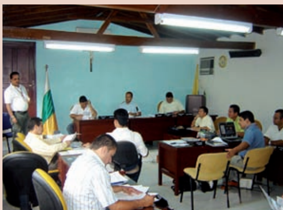
Foto 7. Sesión de Consejo Municipal de Los Patios.

existía una organización comunitaria como tal, la Junta de Acción Comunal no estaba estructurada y carecía del reconocimiento y validación general del colectivo. “La llegada de la Cruz Roja fue para nosotros una bendición, ahora somos más comunidad”, afirmó uno de los líderes comunitarios de Las Cumbres, denotando lo altamente significativo que ha resultado el trabajo de gestión comunitaria 16 . Se reconoce haber aprendido cosas muy útiles y oportunas, la consolidación o empoderamiento de la comunidad, la conciencia de la realidad, aumentó la capacidad de negociación y se ve con mejores ojos el futuro. Quizá lo más significativo es el que los miembros de la comunidad misma se asuman como protagonistas de su propio desarrollo, pensándose más dignos y proactivos, menos resignados y mucho menos dependientes que en otros tiempos.