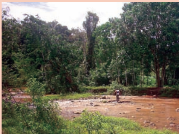
Foto 2: Inundaciones en el distrito de Soritor.

bajas del distrito, inundaciones en las tierras de cultivos de arroz, afectando también los medios de vida de la población en estas zonas. La pérdida de capacidad de infiltración de los suelos y los eventos de sequías disminuyen la disponibilidad del recurso hídrico para sus distintos usos.