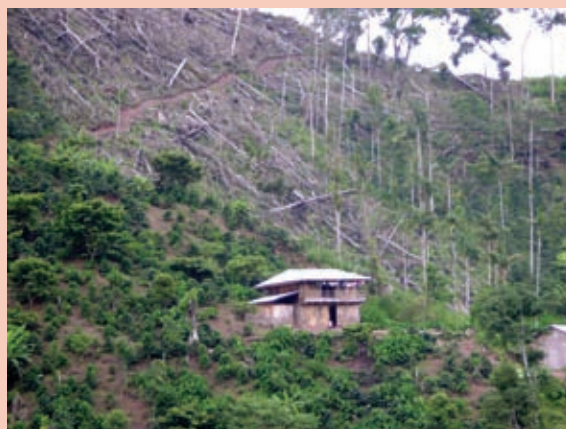
Foto 1: Zona deforestada en el Distrito de Soritor.

La creciente demanda de tierras para vivienda y desarrollo de cultivos ha llevado a una también creciente práctica de tala de árboles, perdiéndose la cobertura vegetal en zonas de protección que albergan fuentes de provisión de agua para el consumo humano y alteran la dinámica ecosistémica. Estos cambios han ido acompañados de una influencia de la cultura andina sobre la amazónica, que ha implicado el abandono de prácticas tradicionales locales, como la del cultivo en secano en pequeñas cantidades, a favor de prácticas vulnerables, como la mecanización de los humedales para el cultivo masivo del arroz. De este modo, la población migrante trae consigo una serie de patrones y conductas con respecto al aprovechamiento de los recursos naturales que en un contexto territorial distinto a la sierra peruana genera de manera acelerada diversas amenazas.