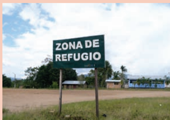
Foto 10: Señalización para emergencias frente a sismos.

ordenamiento territorial, forman parte de los elementos que facilitan la continuidad en los consensos construidos desde el gobierno local, su equipo técnico y la sociedad civil. Estos consensos han permitido la elaboración de ordenanzas y normas operativas (reglamentos, resoluciones, avisos, acuerdos, etc.) que han ido formalizando las decisiones tomadas en el camino.