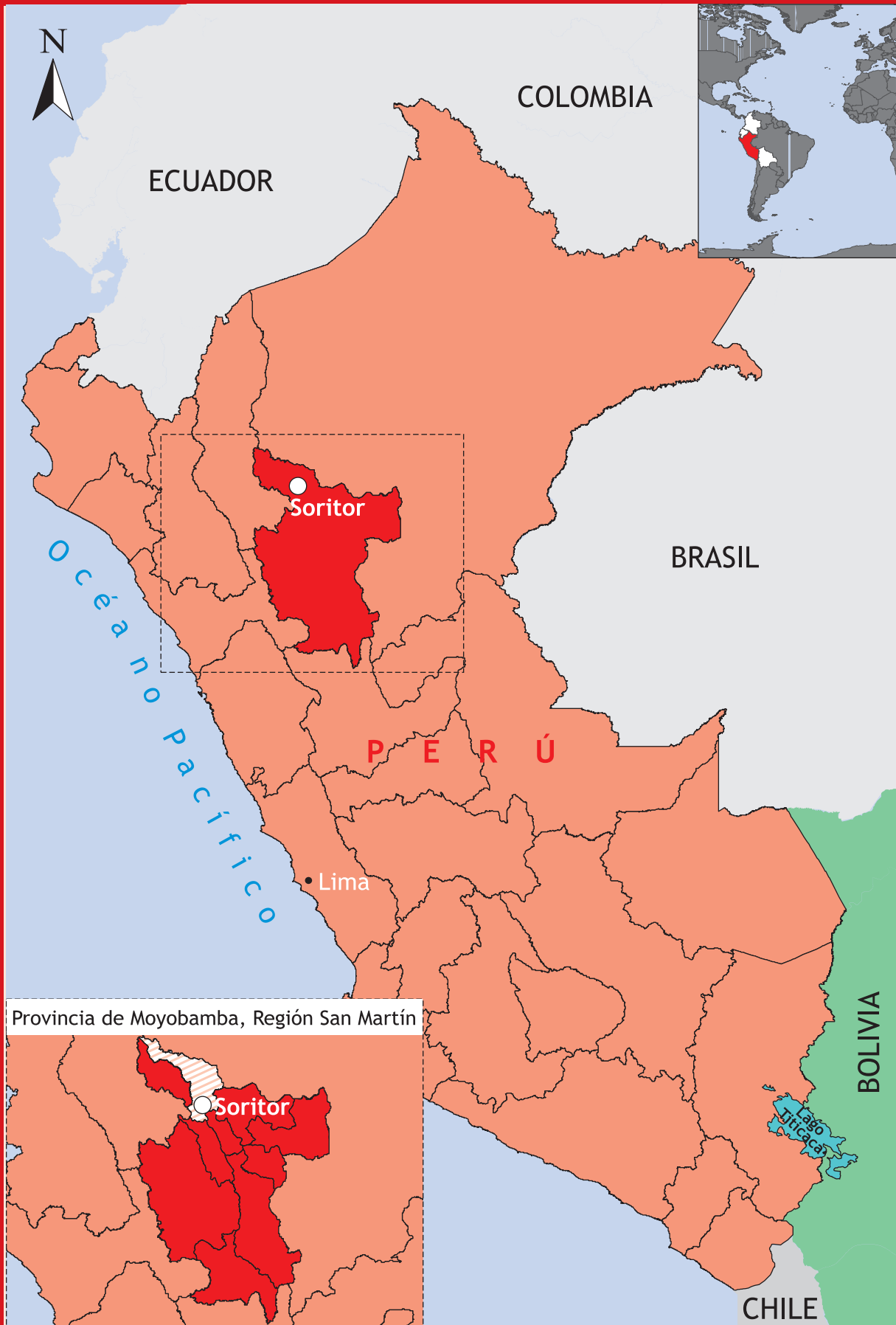
Mapa de ubicación de experiencia