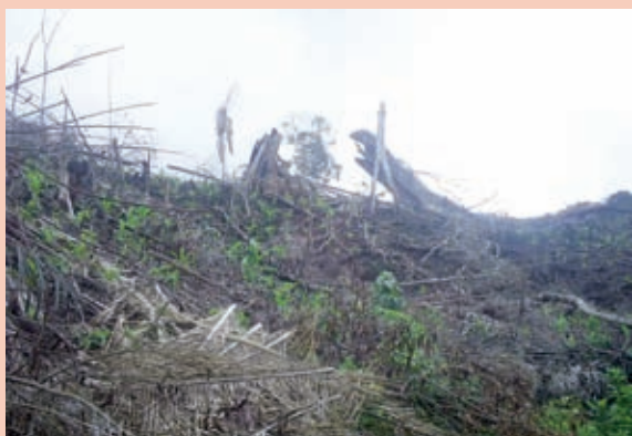
Foto 11: Zona deforestada en el distrito de Soritor.

Los procesos y normas dadas a nivel regional y local van entrando en confrontación con decisiones de nivel nacional, quedando abierta la pregunta de quién hace qué. Una muestra de esta situación han sido las disposiciones dadas a nivel regional y local para el proceso de categorización de los centros poblados, restringiendo la ocupación del territorio. Frente a ello, se tienen las disposiciones de nivel nacional para la titulación de tierras en las que las instituciones competentes otorgan títulos de propiedad, o concesiones forestales, mineras y energéticas, sin considerar los esfuerzos de control del riesgo a nivel regional y local.