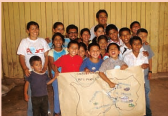
Foto 6: Talleres en escuelas del distrito de Soritor.

Las orientaciones disponibles a nivel normativo que definen y conducen los presupuestos participativos se han constituido en un apoyo para los procesos de planificación iniciados desde los gobiernos locales, incluyendo las iniciativas participativas para impulsar acciones de disminución del riesgo. La Ley Orgánica de Municipalidades; que asigna competencias a los gobiernos locales para asumir el desarrollo sostenible, exige a las autoridades locales el tomar en cuenta los distintos aspectos que garanticen este desarrollo, para lo cual resulta imprescindible trabajar el componente del riesgo.