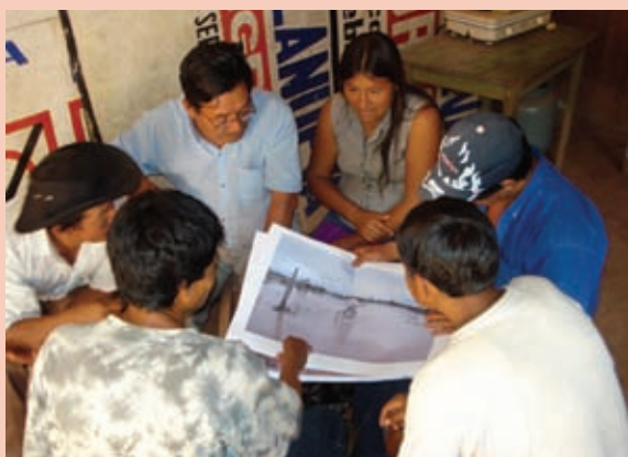
Foto 5: Talleres participativos con la población.

El involucramiento de la población se dio principalmente a través de los agentes municipales de los centros poblados, quienes representan a la población en los espacios del presupuesto participativo, además de ser los encargados de establecer las coordinaciones con el gobierno local. En ese sentido, la participación de la población se ha dado de manera indirecta.