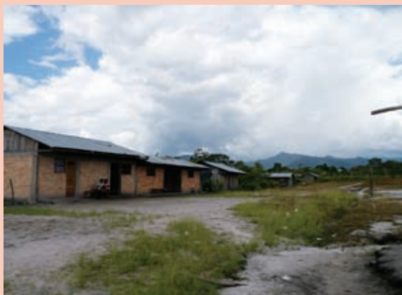
Foto 7: Viviendas de familias reubicadas por deslizamiento.

“Soritor es un distrito con alto riesgo de terremotos, de deslizamientos, nuestros suelos son bastante frágiles. Yo he vivido como seis terremotos, más o menos cada 10 años hay uno. Cuando estuve en la municipalidad tuvimos un desastre de asentamiento de suelos, hubo una semana de lluvias y tuvimos que reubicar un caserío porque empezó a hundirse, a rajarse la tierra como si hubiese habido un terremoto. Las grandes crecidas de los ríos es otro riesgo para las tierras productivas. Este es un tema amplio que requiere mucha inversión, pero sobre todo tener las ideas claras.” 20