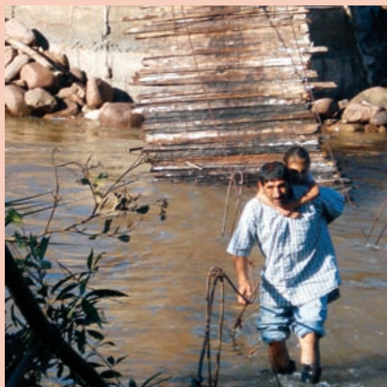
Foto 4: Caída de puente y pérdida de infraestructura por lluvias intensas.

Durante este período, se presentaron eventos de deslizamientos y situaciones de emergencia que llevaron al gobierno local a reubicar a un centro poblado de migrantes (180 personas aproximadamente) en espacios más seguros y cercanos al centro urbano del distrito.