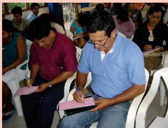
Foto 9: Talleres para la construcción participativa de instrumentos de gestión.

local de los instrumentos de planeamiento y gestión ambiental, en el marco del sistema nacional y regional de gestión ambiental. Estos proyectos deben implicar modificar el estado natural de los recursos naturales y contar con el estudio de impacto ambiental con el detalle correspondiente.