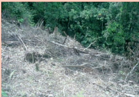
Foto 3: Tala indiscriminada en el Distrito de Soritor.

local, logrando la conformación de un equipo de trabajo que lidera y conduce el proceso a lo largo del período de gobierno. Así, ya en 2003, la propuesta concertada por quienes se encontraban a cargo del gobierno local fue puesta a consideración de la población, a partir de los espacios para la elaboración de los presupuestos participativos 1 , lográndose una paulatina aceptación.