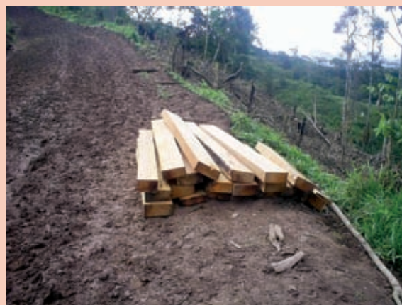
Foto 8: Extracción ilegal de madera.

La zonificación ecológica económica (1:100 000) 21 identifica tanto zonas de protección como de recuperación. En las zonas de protección se encuentran las áreas de conservación municipal, que representan 1,36% del territorio; estas se constituyeron en fuentes de extracción de madera y especies maderables de gran importancia comercial. La limitación más importante es la presión de la actividad de tala para el comercio de madera e instalación de pastos para la ganadería. Como uso recomendable para esta zona se ha definido el turismo, la conservación, la reforestación y la investigación.