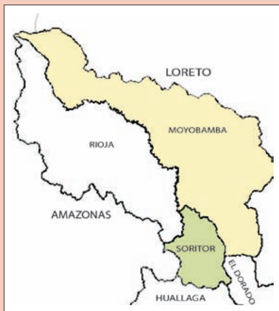
Figura 1: Mapa de ubicación del distrito de Soritor.

El distrito de Soritor se encuentra ubicado en la provincia de Moyobamba, departamento de San Martín, al nororiente de la faja subandina de la Cordillera de los Andes, en la zona denominada Alto Mayo. La extensión del territorio del distrito es de 60 161,13 hectáreas, y tiene 23 000 habitantes, 80% de los cuales son pobladores migrantes de otras regiones, principalmente de la sierra norte del Perú.