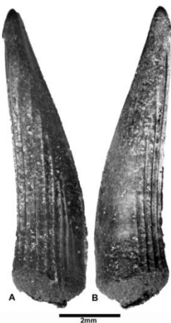
[figura 2] Vista lateral de un diente de Enchodus cf. E. gladiolus (Formación Vivian).

Descripción: Dientes relativamente pequeños –los más grandes miden 8 mm de largo y 2 mm de ancho en su base–, delgados, comprimidos distalmente y levemente sigmoidales. La sección transversal es elíptica y simétrica. El sector apical posee una barba post-apical pequeña. Las escasas estriaciones longitudinales son paralelas y muy marcadas; una de las caras del diente carece de estrías en su parte antero-basal. La carena anterior posee un aserrado delicado (más bien un borde ondulado) sólo visible al MEB. La carena posterior es lisa.