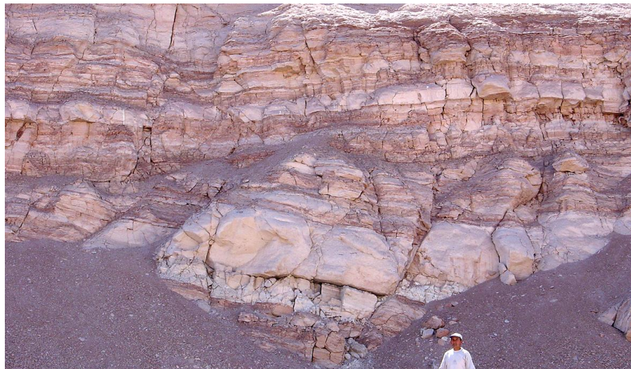
Figura 3. Ejemplo típico de deformación extensional sinsedimentaria, con fallas normales selladas, en estratos areno-pelíticos de la unidad Moquegua B. Carretera Panamericana, ~2.4 km al suroeste del puente sobre el río Vitor, y ~45 km al OSO de la ciudad de Arequipa; coordenadas: latitud 16.473973°S, longitud 71.948831°W.