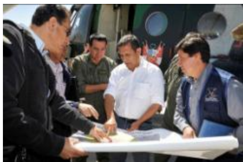
Fig. 5: Mostrando mapa de peligros del Ubinas al Presidente de la Nación y al Presidente Regional de Moquegua.