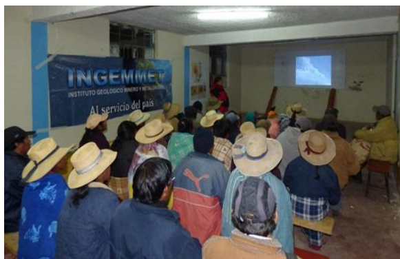
Fig.7: Capacitaciones a la población del Valle de Ubinas- Moquegua

En base a todo este trabajo realizado, se ha logrado la toma de conciencia por autoridades y pobladores de las zonas de riesgo en Arequipa y Moquegua, los cuales vienen trabajando en la gestión de riesgo de desastres; en la implementación de albergues, rutas de evacuación, ayuda humanitaria, suministro de mascarillas y lentes etc. Además de ello en base a los Comunicados que ya son 6 a la fecha, se ha venido dando recomendaciones a las autoridades para salvaguardar la integridad de las personas y sus bienes, las cuales van siendo implementadas por las autoridades. Por otro lado, cabe señalar que la población del valle de Ubinas no quería evacuar, ya que solicitaban la reubicación, siendo dos cosas muy distintas, pero luego de las capacitaciones por el OVI, ellos evacuaron. A la fecha no ha habido ni heridos ni pérdidas humanas que lamentar, pese al proceso eruptivo moderado que viene presentando el Ubinas. Esto es en gran medida al esfuerzo del INGEMMET en realizar los diferentes trabajos en el volcán y al asesoramiento continuo a autoridades y población.