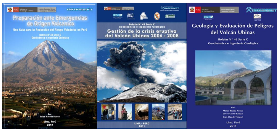
Fig.9: Material educativo y boletines con información relevante sobre el Ubinas