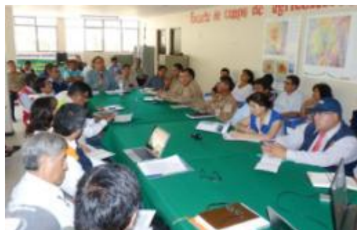
Fig. 6: Reuniones diversas con funcionarios de las diferentes gerencias para la toma de decisiones