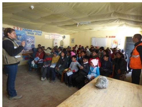
Fig.8: Capacitaciones a la población de San Juan de Tarucani - Arequipa