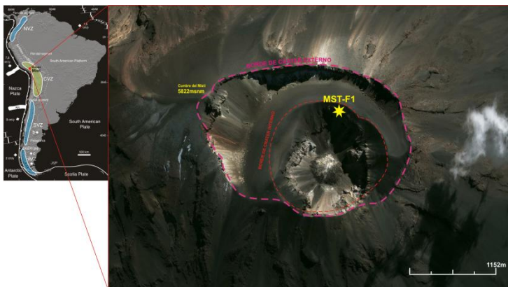
Figura 1. Mapa de ubicación del sitio MST-F1, en el borde norte del cráter interno del volcán Misti. El sensor de temperatura ha sido enterrado en el suelo a 30 cm de profundidad. En el recuadro de la izquierda se observa la ubicación del volcán Misti dentro de la Zona Volcánica Central (CVZ) de América del Sur.

En este trabajo se presentan los resultados preliminares del monitoreo de temperatura del suelo a 30 cm de profundidad en el cráter del volcán Misti en el periodo 2004-2011. La posible contribución de las mareas terrestres en el disparo de erupciones volcánicas ha sido observada en ambientes de volcanismo basáltico (Dzurisin, 1980; Van Manen et al., 2010; Sottili & Palladino, 2012), pero no se han reportado tal tipo de fenómeno en volcanes de arco. El volcán Misti es un volcán andesítico activo que no está en erupción pero que presenta, por ciertos lapsos de tiempo, una actividad fumarólica intensa al nivel de su cráter interno y en sus inmediaciones. El objetivo del presente trabajo es mostrar que en el volcán Misti se han observado variaciones de tipo periódico de la temperatura del suelo, y que dichas variaciones podrían tener asociación con las mareas terrestres. Los datos de temperatura provienen de la cúspide del volcán, a inmediaciones de la zona de fumarolas del cráter; los datos de la marea terrestre provienen de cálculos teóricos válidos para la zona donde se ubica el volcán.