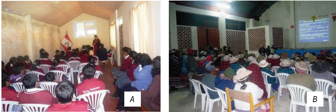
Figura 4. A) Capacitación a estudiantes de la Institución Educativa de Madrigal; B) Charla a los integrantes de la Comisión de Regantes del distrito de Madrigal.