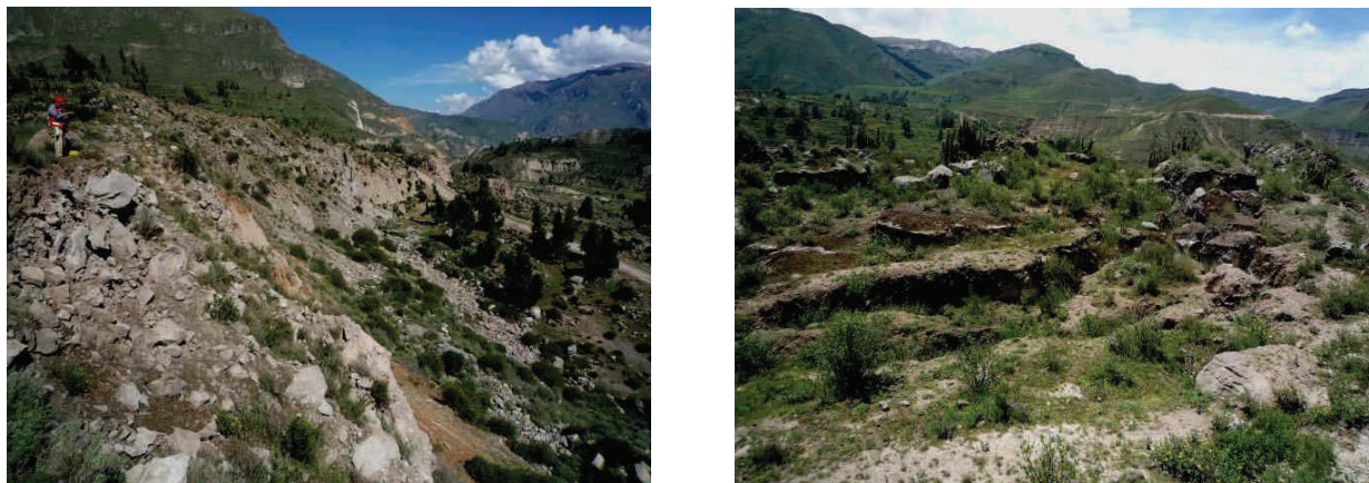
Figura 3. Escarpas, asentamientos y grietas en el cuerpo del deslizamiento de Maca.

de Madrigal. El deslizamiento de Maca (figura 3), es un deslizamiento antiguo, de aproximadamente 3,7 km de longitud de escarpa, en cuyo cuerpo principal se han reactivado nuevos deslizamientos, que actualmente presentan un avance progresivo. Las principales reactivaciones se produjeron el año 1991, con el sismo que tuvo como epicentro el poblado de Maca. Los deslizamientos vienen produciendo la pérdida de áreas de cultivo (andenes) y pastizales en los sectores de Maca-Chacaña, Madrigal-Lari, Ichupampa, cerro Antahuilque. Así mismo, vienen afectando varios tramos de la carretera entre Chivay y Cabanaconde, Maca-Lari, el complejo de Baños Termales La Calera, canales de irrigación, entre otras obras de infraestructura.