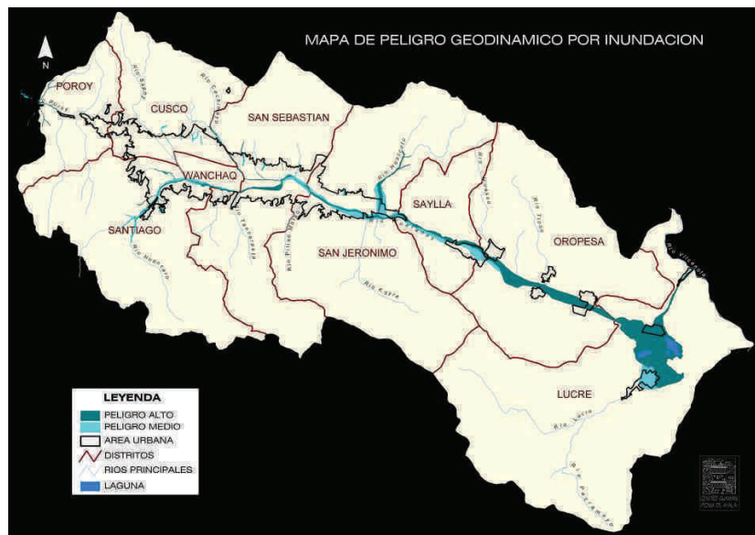
Fig. 1. Mapa de peligros por inundación actualizado al 2010.