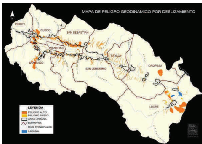
Fig. 3. Mapa de peligros por deslizamientos actualizado al 2010