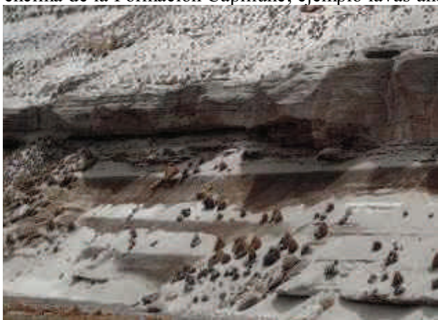
Foto 1. Estratos horizontales a sub horizontales de la Formación Capillune, evidenciando niveles saturados y niveles impermeables.

La Formación Capillune, tiene estratificación horizontal a subhorizontal, cerca a su contacto con rocas más antiguas, presentan buzamientos entre 20 y 25°. Su litología se compone de una intercalación de areniscas, arcillas, conglomerados y piroclásticos que se presentan en capas delgadas grises, blanquecinas y anaranjadas. La configuración de sus estratos y su litología genera heterogeneidad acentuada, principalmente por que las capas sub-horizontales tienen variada composición litológica, por lo tanto su comportamiento hidráulico también es variable, los horizontes permeables tienen una acentuada permeabilidad horizontal (fotos 1 y 2). Este componente litológico nos permite clasificar a los horizontes de areniscas tobaceas, piroclastos y lapillis en acuíferos y a los horizontes de arcillas, cenizas y limos como acuitardos, por lo tanto esta formación es típica de acuíferos multicapa, y que en sectores se encuentran confinados. En el sector de Pati, se observa que gran parte de estas surgencias originan numerosos manantiales que forman grandes bofedales (foto 2). La parte superior de esta formación, donde coincide con estratos impermeables se comportan también como controles para la surgencia de manantiales, que proviene de acuíferos ubicados por encima de la Formación Capillune, ejemplo lavas andesíticas fisuradas del Grupo Barroso.