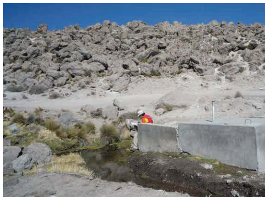
Foto 3. Manantiales que surgen entre las lavas del Grupo Barroso en contacto con cenizas y piroclastos impermeables

El Grupo Barroso congrega a varios estratos volcán del plioceno reciente, formados principalmente por lavas andesíticas gris oscuras. En varios sectores se encuentran coronando la parte superior y los flancos de las estructuras volcánicas, en otros, sobreyace a las tobas blancas del Grupo Maure. Estas lavas andesíticas tienen predominancia de fracturas verticales formadas por enfriamiento y coincidente con la dirección de emplazamiento de las lavas, estas fracturas son las que almacenan las aguas subterráneas y condicionan la dirección de flujo de las surgencias. El modelo hidrogeológico conceptual del acuífero Barroso se inicia con la recarga que recibe de la precipitación pluvial, estas se infiltra en sus fracturas, circula en