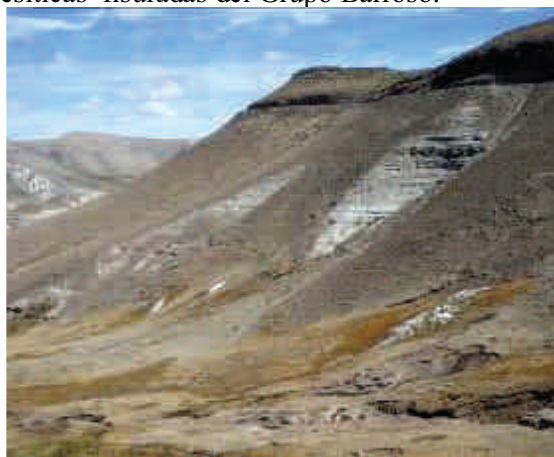
Foto 2. Descarga de manantiales en el acuífero multicapa de la Formación Capillune originando bofedales de ladera. sector Pati.