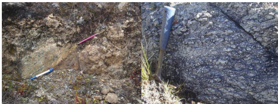
Figura 2. Superposición de serpentinitas del Macizo de Tapo sobre areniscas del Grupo Ambo. Nótese la intensa cataclasis de ambas rocas (foto de la izquierda). Milonitas de metagabro en el contacto con las filitas del Grupo Huácar, cuerpos ultramáfico-máficos de Acobamba (fotografía de la derecha).

En estos dos pequeños cuerpos de ultramafitas, la deformación interna es polifásica e idéntica en todo al cuerpo ultramáfico-máfico de Tapo. Se distingue una foliación principal (Sn), penetrativa, de origen no-coaxial, como se puede comprobar por la abundancia de varios indicadores cinemáticos típicos de este tipo de deformación (sistemas de porfiroclastos, estructuras C/S). La presencia de planos S cizallados indica la existencia de un episodio anterior que generó una foliación, también penetrativa, referida como Sn-1. Se observa una intensa filonitización en las filitas del contacto con las serpentinitas, la cual tiende a desaparecer cuando aumenta la distancia al contacto. Las rocas ultramáficas también están milonitizadas. Las lineaciones poco usuales observadas tienen orientaciones que siguen la dirección del plano que las contiene. Los gradientes espaciales de la fábrica ocurren también en los metagabros de Tapo, donde se observa un paso gradual de metagabros foliados a metagabros milonitizados (Figura 2). Esta asociación de mesoestructuras, que evidencian una deformación fuertemente no-coaxial y gradientes espaciales de la fábrica, permite interpretar la existencia de accidentes de cizalla. El accidente que divide longitudinalmente el cuerpo de Tapo, o los accidentes basales de los pequeños cuerpos de serpentinita de Acobamba son también ejemplos de ello.