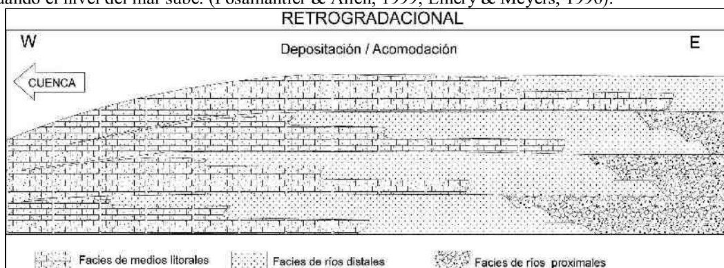
Fig. 3.- Modelo teórico mostrando ciclos retrogradacionales de las facies en función de las fluctuaciones eustáticas.

cuenca, sucede un sistema transgresivo originando una retrogradación de las facies hacia el continente (Fig. 3). El desplazamiento del litoral hacia el continente en respuesta a una transgresión ocurre cuando el nivel del mar sube. (Posamentier & Allen, 1999; Emery & Meyers, 1996).