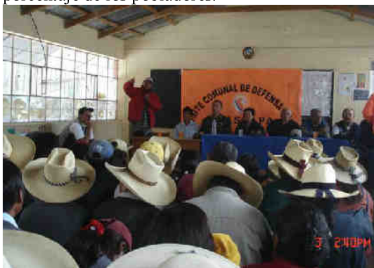
Fig. 2.- Explicación del contenido y utilidad del mapa de peligros en el pueblo de Anascapa.

Durante los años 2006 y 2007, el contenido y significado del mapa de peligros, fue expuesto en innumerables reuniones de trabajo a funcionarios del Gobierno Regional de Moquegua, la Municipalidad Distrital de Ubinas, INDECI, profesores y alumnos, además de pobladores del valle de Ubinas (Figs. 2 y 3). A pesar que la zona afectada posee una población pequeña, alrededor de 3500 habitantes, el mapa de peligros tuvo una difusión parcial y su contenido fue conocido por un reducido porcentaje de los pobladores.