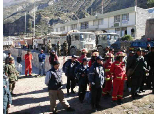
Fig. 7.- Preparativos para la evacuación de los pobladores de Ubinas.