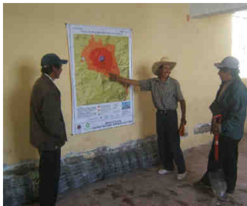
Fig. 5.- Mapa de peligros del volcán Ubinas, expuesto en el local comunal de Querapi.