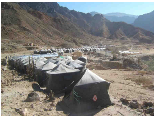
Fig. 8.- Refugio de Chacchagén. En este lugar permanecieron durante más de medio año pobladores de Ubinas, Tonohaya, San Miguel, Huarina y Escacha.