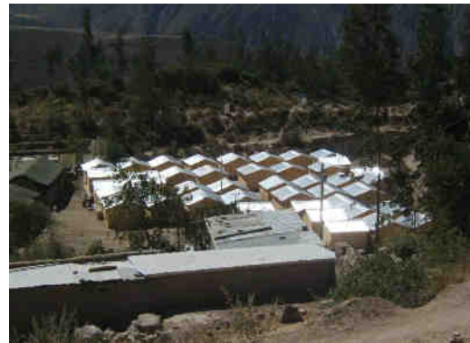
Fig. 9.- Refugio de Anascapa. En este lugar permanecieron durante más de ocho meses los pobladores de Querapi.