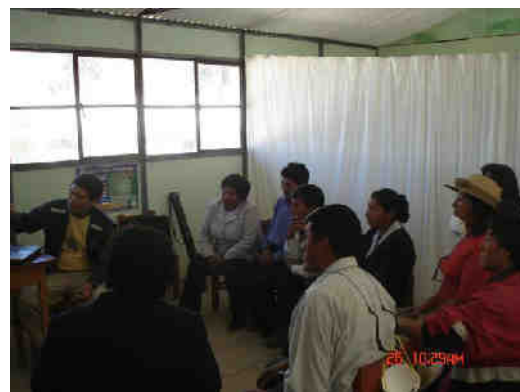
Fig. 3.- Taller para profesores del valle de Ubinas, donde se explican los principales peligros volcánicos y el mapa de peligros.