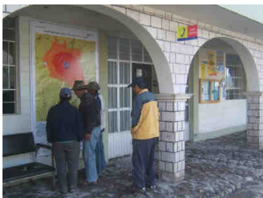
Fig. 4.- Mapa de peligros del volcán Ubinas, expuesto en el local de la municipalidad distrital de Ubinas.

Por otro lado, varias instituciones entre las que destacan las ONGs Caritas Moquegua, Oxfam América, el Gobierno Regional de Moquegua, la Municipalidad Distrital de Ubinas y el INGEMMET, emprendieron durante el año 2007, la difusión masiva del mapa de peligros del volcán Ubinas, en el marco del proyecto “LLUSP’Y: CONVIVIENDO CON EL RIESGO, ERUPCIÓN DEL VOLCÁN UBINAS”. Para la difusión del mapa de peligros, se imprimieron varios cientos de mapas. Actualmente, el mapa de peligros del volcán Ubinas, se encuentra estratégicamente expuesto en muchos lugares públicos de la zona afectada por la erupción (Figs. 4 y 5), tales como la municipalidad distrital, locales comunales, centros educativos, centros de salud, restaurantes y tiendas comerciales, entre otros. Esta difusión viene permitiendo a los pobladores un mejor conocimiento de su entorno y de los peligros al que está expuesto.