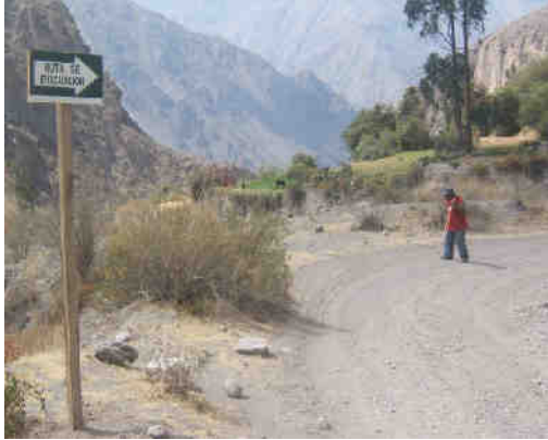
Fig. 6.- Señalización de rutas de evacuación en el pueblo de Tonohaya.