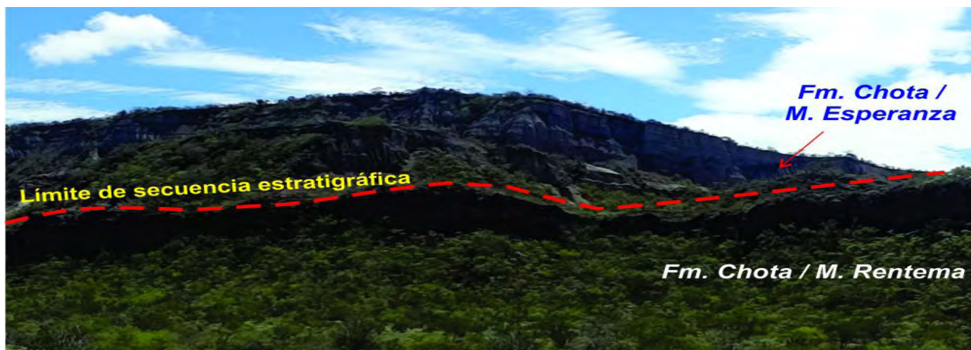
Figura 4. Vista hacia el oeste de la Formación Chota y sus dos miembros, en la quebrada Huarangopampa.

Encima del miembro inferior (Rentema), se ha cartografiado el miembro superior (Esperanza) con dificultad por estar en gran parte cubierto por sus derrubios. Sin embargo, su arquitectura estratigráfica se aprecia en la localidad de Esperanza, de donde se toma la toponimia, y se reconocen facies detríticas finas constituidas por lutitas calcáreas abigarradas (con matices rojo a púrpura y verde), que varían en algunos