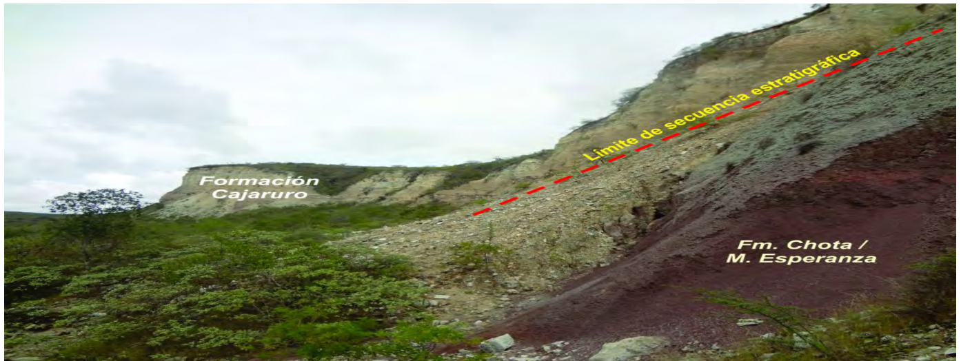
Figura 5. Posición estratigráfica del Miembro superior de la Formación Chota, que subyace a la Formación Cajaruro.